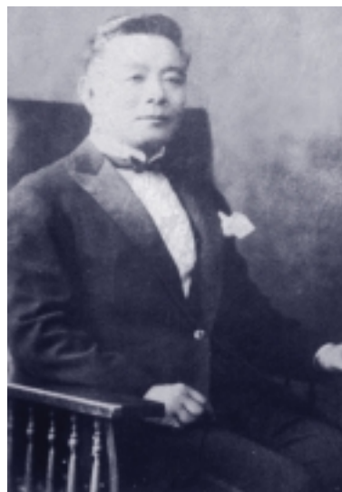
Mitsuyo Maeda, já cognominado Conde Koma, em foto feita no Brasil, onde veio a se estabelecer.

Retornando à América, passou por Cuba e chegou ao Brasil, pelo porto de Santos, mas sediou-se em Belém, no Pará, onde ensinava Judô e Jiu-jitsu. Já era um Jiu-jitsu próprio que veio a passar a Carlos Gracie, Hélio Gracie e George Gracie. E foi a família Gracie que elaborou outra versão do Jiu-jitsu de Maeda, adaptada aos seus físicos e técnicas dando origem ao Brazilian Gracie Jiu-jitsu.