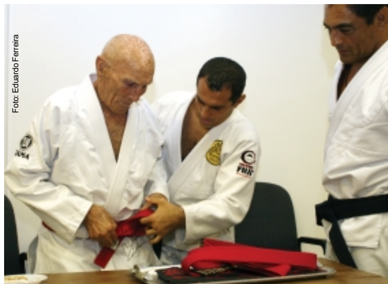
Hélio recebe a faixa vermelha com 10 graus bordados a ouro das mãos dos filhos Rickson e Royler, em seu aniversário de 95 anos.

Durante mais de 80 anos de atividade esportiva, teve combates memoráveis, entre os quais duas lutas especialmente famosas. A primeira contra o japonês campeão mundial Masahito Kimura – 35 quilos mais pesado e quatro anos mais jovem – em 23 de outubro de 1951, no Maracanã-RJ, diante um público de 20 mil pessoas. Kimura havia prometido finalizar Hélio em três minutos (o estipulado para o combate eram três rounds de 10 minutos). No segundo round, Kimura aplicou uma chave de braço udegarami invertida. Não havia como sair. Percebendo que Hélio não batia e ia deixar seu braço quebrar, Carlos invadiu o ringue e deu as três pancadas no tablado. Reconhecendo